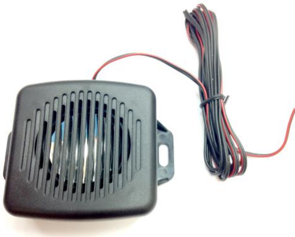
Рис. 1.1. Внешний вид динамика Вега СД-1.

Динамик Вега СД-1 предназначен для подключения к устройствам с целью воспроизведения звука. Динамик подключается к усилителю двумя проводами. Также динамик имеет крепежные отверстия с двух сторон корпуса.